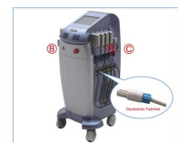
Lipolaser FG 660H-001 Multipads (Behandlungsplatten)